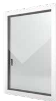
Nova-line 77 PVC / PVC