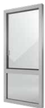
Nova-line 77+8 PVC / Alluminio